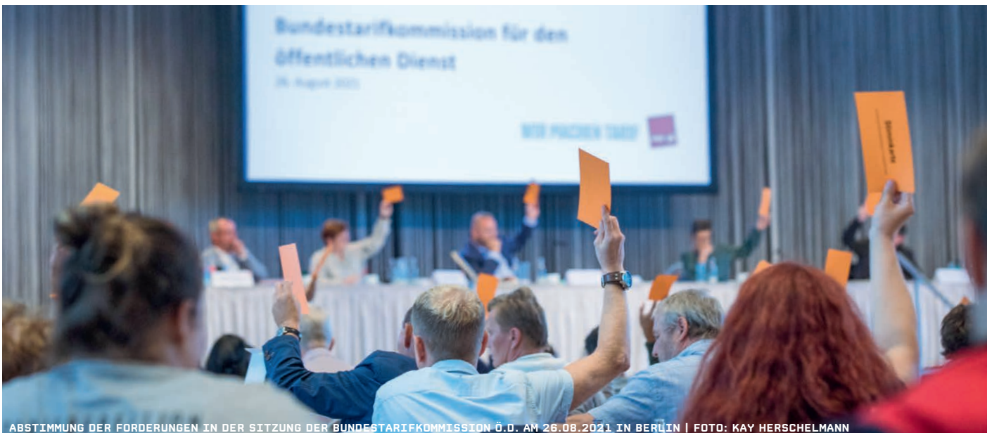
ABSTIMMUNG DER FORDERUNGEN IN DER SITZUNG DER BUNDESTARIFKOMMISSION Ö.D. AM 26.08.2021 IN BERLIN

Wir halten den Laden am Laufen. Handeln. Für Morgen!