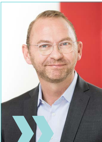
Frank Werneke ver.di-Vorsitzender

Die Länder werden aufgefordert, das Verhandlungsergebnis zeit- und wirkungsgleich auf die Beamt*innen sowie auf Versorgungsempfänger*innen der Länder und Kommunen zu übertragen.